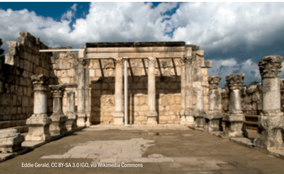
Eddie Gerald, CC BY-SA 3.0 IGO, via Wikimedia Commons

Zaczerpnięto z serii „Geography of Bible Lands” Home Horizons , październik 2022 Eastern Mennonite Publications